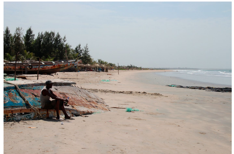
Fisherman on Gunjur beach.